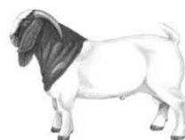
Voorzitter fokcommissie Boergeiten