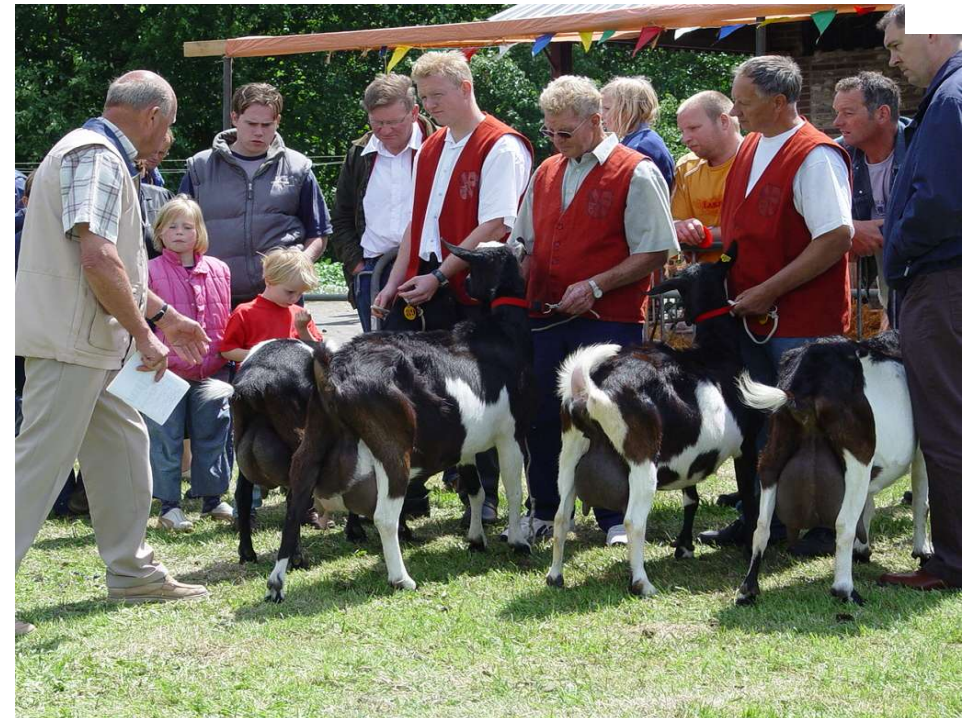
Boven een mooie groep bonte geiten op de verenigingskeuring van 2004 en onder een sfeerfoto eveneens op dezelfde keuring