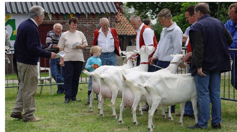
Meer informatie kunt u opvragen bij een van de bestuursleden, maar ook vinden op internet onder adres http://www.geocities.com/sintanna