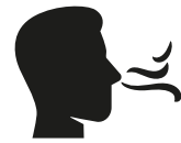
Reuk- en/of smaak- verlies

Heb je op dit moment een huisgenoot met milde klachten en koorts en/of benaauwdheid?