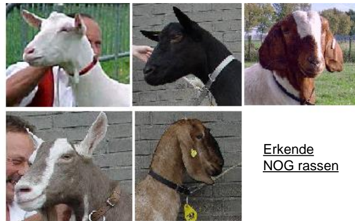
Erkende NOG rassen